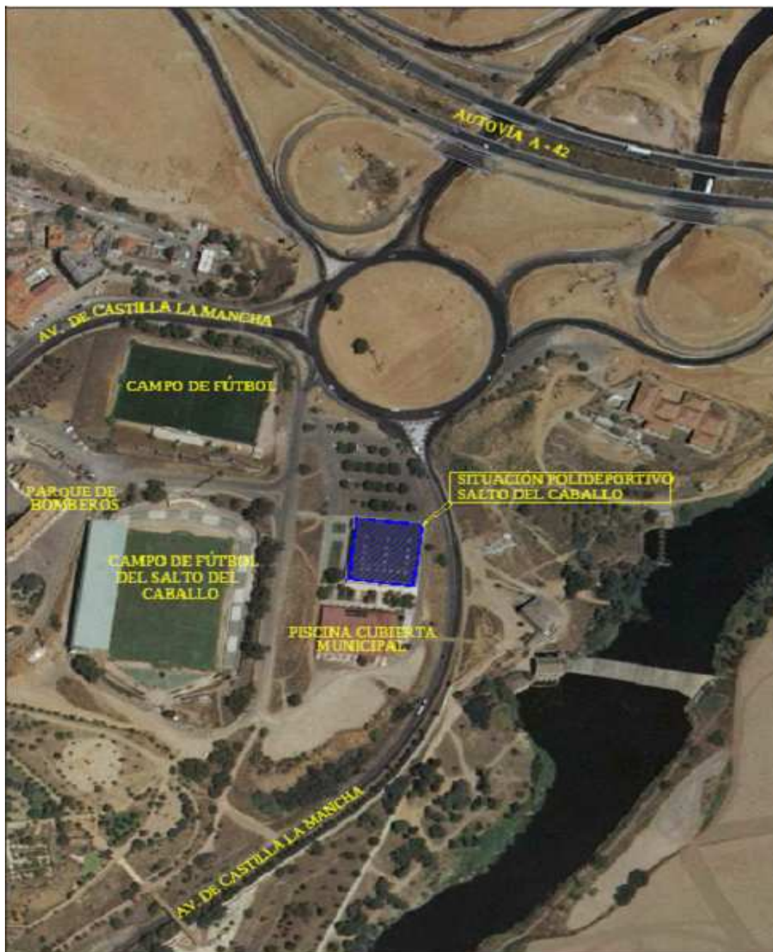
PLANO DE SITUACIÓN DEL PABELLÓN MUNICIPAL DEL SALTO DEL CABALLO EN TOLEDO